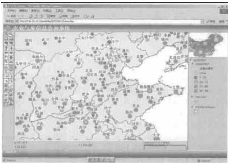
图 3 2002 年 8 月中旬的 20 cm 土壤相对湿度等级分布专题图

为了满足一些专业用户对获取更详细信息的需求,研究中利用 Arc Map 地理地图编