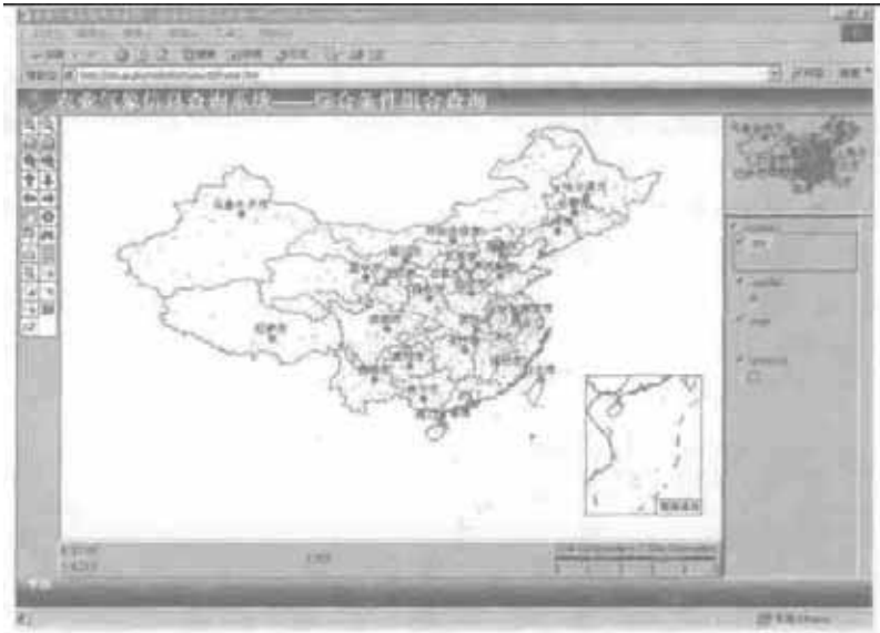
图 2(b) 基于属性到空间的基本气象信息综合条件查询结果 (空间分布的站点位置)

度;也可以通过在地图上选择站点的方式,查询得到 2000 年 1 月上旬新疆各地的基本气象信息,实现由空间到属性的查询(图略)。此外,为了满足对指定的基本气象要素的查询,除了可以从综合历史数据库中获得基本农业气象信息的查询数据外,还可以直接检索特定年份或气象要素的方法进行快速查询。