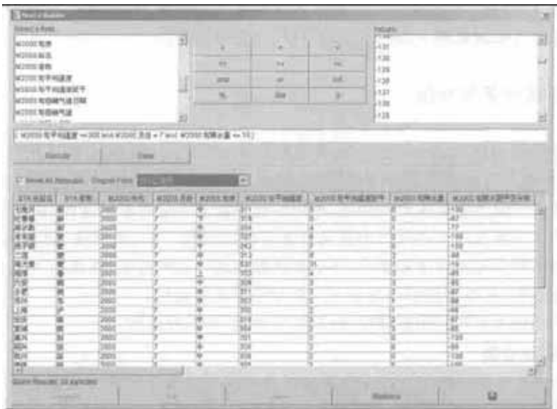
图 2(a) 基于属性到空间的基本气象信息综合查询条件及查询结果浏览表

在客户端的浏览器上,用户可根据需求任意选择空间地理位置或输入所需要查询农业气象属性查询综合条件,向 WebGIS 服务器检索农业气象信息数据库中相应的数据,实现单要素或多要素组合的空间和属性之间的双向查询。例如,图 2(a、b)为根据用户提交的符合 2000 年 7 月各旬平均温度 \geq 30\text{ }^{\circ}\text{C} 、旬降水量 \leq 10\text{ mm} 综合条件,由属性到空间的查询结果(包括数据浏览表和符合条件的空间分布图)。从图 2(b)中可以看到,2000 年 7 月高温少雨的天气主要发生在浙江、江西北部、安徽南部及内蒙古中部、新疆部分地区,且有明显的地域分布特征。这种由属性到空间的综合查询信息对于用户了解某一气象条件的空间分布状况十分有用,可以了解高温、低温、干旱、暴雨等灾害性天气发生的范围和程